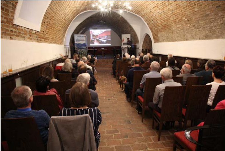
Gut besuchter Vortragsabend