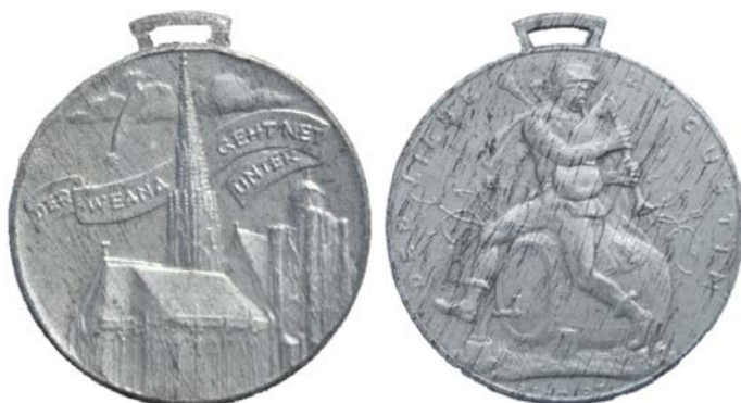
„Der liebe Augustin“, 1941 Zink-Guss, 40 mm Text im Revers: „DER WEANA GEHT NET UNTER“ Abb. 3 und 4

In weiterer Folge wurden Erzeugnisse aus Terrakotta, ein Prägestempel und Beispiele von Gipsabgüssen und dazu die entsprechenden Ausführungen der Medaillen in Metall, gezeigt. Erzeugnisse in minderwertigem Material, wie „Der liebe Augustin“, die aber weit verbreitet wurden, konnten auch vorgelegt werden.