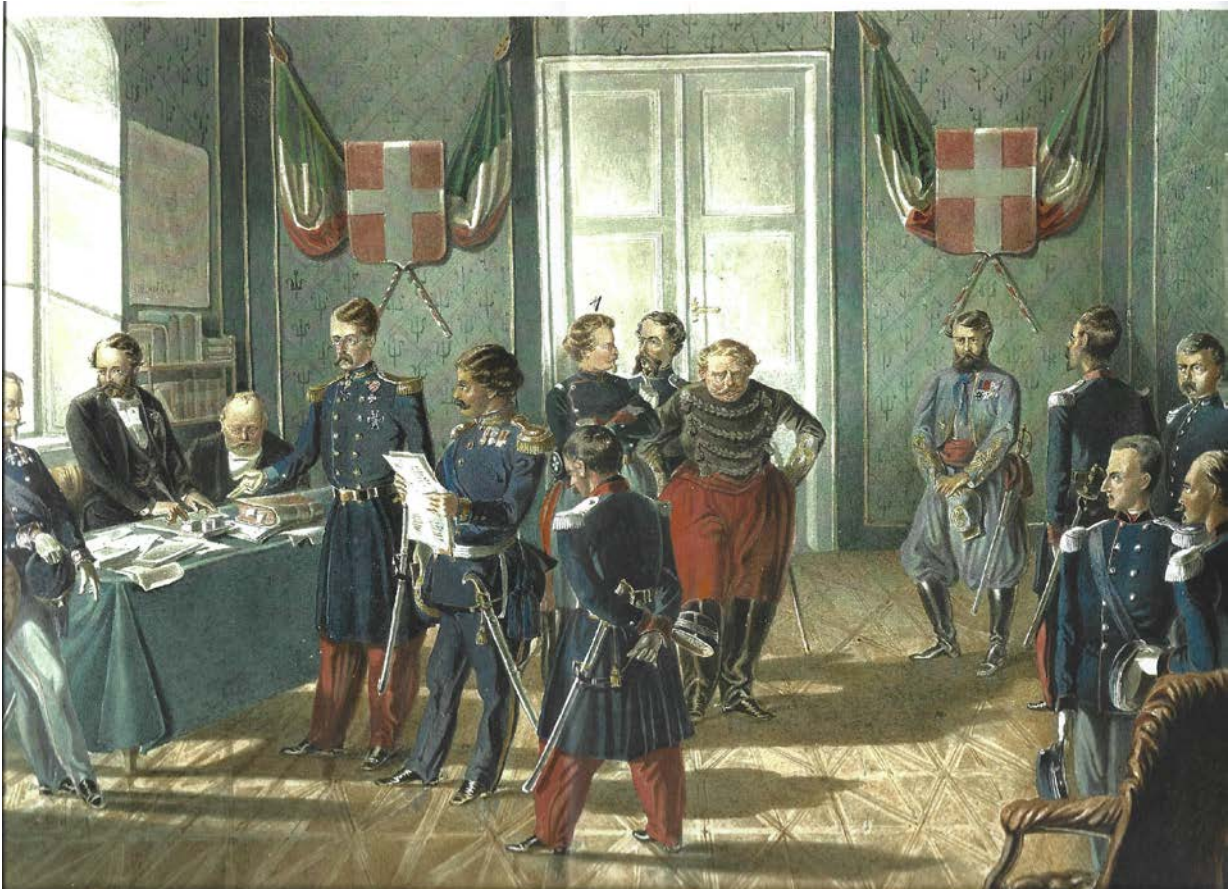
Abb. 2.: Die Ausgabe der Einquartierungspapiere für die Kriegsgefangenen Offiziere am 20.09. im Rathaus von Recanati

Die kleine Ausstellung in der Münze zeigte neben vier Originalmedaillen erstmals original Zeichnungen und Aquarelle des Prinzen Victor Odescalchi (1833-1880) der als junger Major an der Schlacht als Kavallerist teilnahm. Die Zeichnungen und Aquarelle, z.T. erst zwei oder drei Jahre nach den Ereignissen entstanden, zeigen Odescalchi neben dem hohen Offizier Graf Zichy gegen 1. Uhr mittags des 18.09., die Flucht der Dragoner (18.09.), den Tod des Generals Pimodan (18.09.), die Waffenstreckung der päpstlichen Armee bei Recanati am Abend des 19.09. und die Ausgabe der Einquartierungspapiere für die Kriegsgefangenen Offiziere am 20.09. im Rathaus von Recanati. Die letzte Darstellung gibt trefflich den niedergeschlagenen Zustand der päpstlichen Offiziere wider, die alle in ihren Uniformen mit Orden und Säbeln dargestellt sind. Tote gab es auf beiden Seiten, bei den Päpstlichen 88 Tote, bei den Piemontesen 61 Tote. Die letzte Schlacht besiegelte die territoriale Beschränkung des Kirchenstaates auf Rom, der mit dieser Schlacht die Marken und Umbrien verloren hatte.