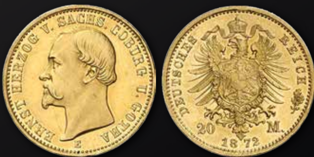
Künker-Auktion 200 Sachsen-Coburg-Gotha. Ernst II., 1844 - 1893. 20 Mark 1872. Dies ist der seltenste Typ aller Reichsgoldmünzen. Schätzung: 75.000 Euro, Zuschlag: 130.000 Euro