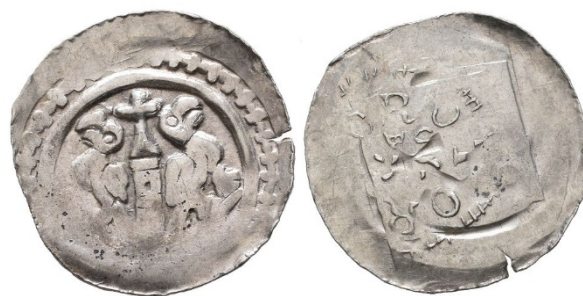
Abb. 1.: Pfennig, Kärnten ? (0,72g.). Sauer 2020, Nr. A7. Maßstab 2 : 1.

Zwei Jahre nach der Drucklegung der letzten ausführlichen Aufarbeitung des Grazer Pfennigs 1 wurde im Münzhandel ein Stück mit einem gut erkennbaren Revers angeboten, der bis dato unbekannt war. In der Literatur fand sich lediglich ein schriftlicher Hinweis auf ein Stück mit identifizierbarem Revers; 2 eine Abbildung, die dies bestätigt hätte, wurde allerdings nicht beigelegt. Ob es sich bei dem hier vorgestellten Pfennig um das Stück aus der Privatsammlung Egon Baumgartners handelt, kann nicht mit Bestimmtheit festgestellt werden; unsere neue Münze bestätigt aber seinen Hinweis aus dem Jahr 1947. Es handelt sich um einen Pfennig Albrechts I. (1283–1298; Abb. 1).