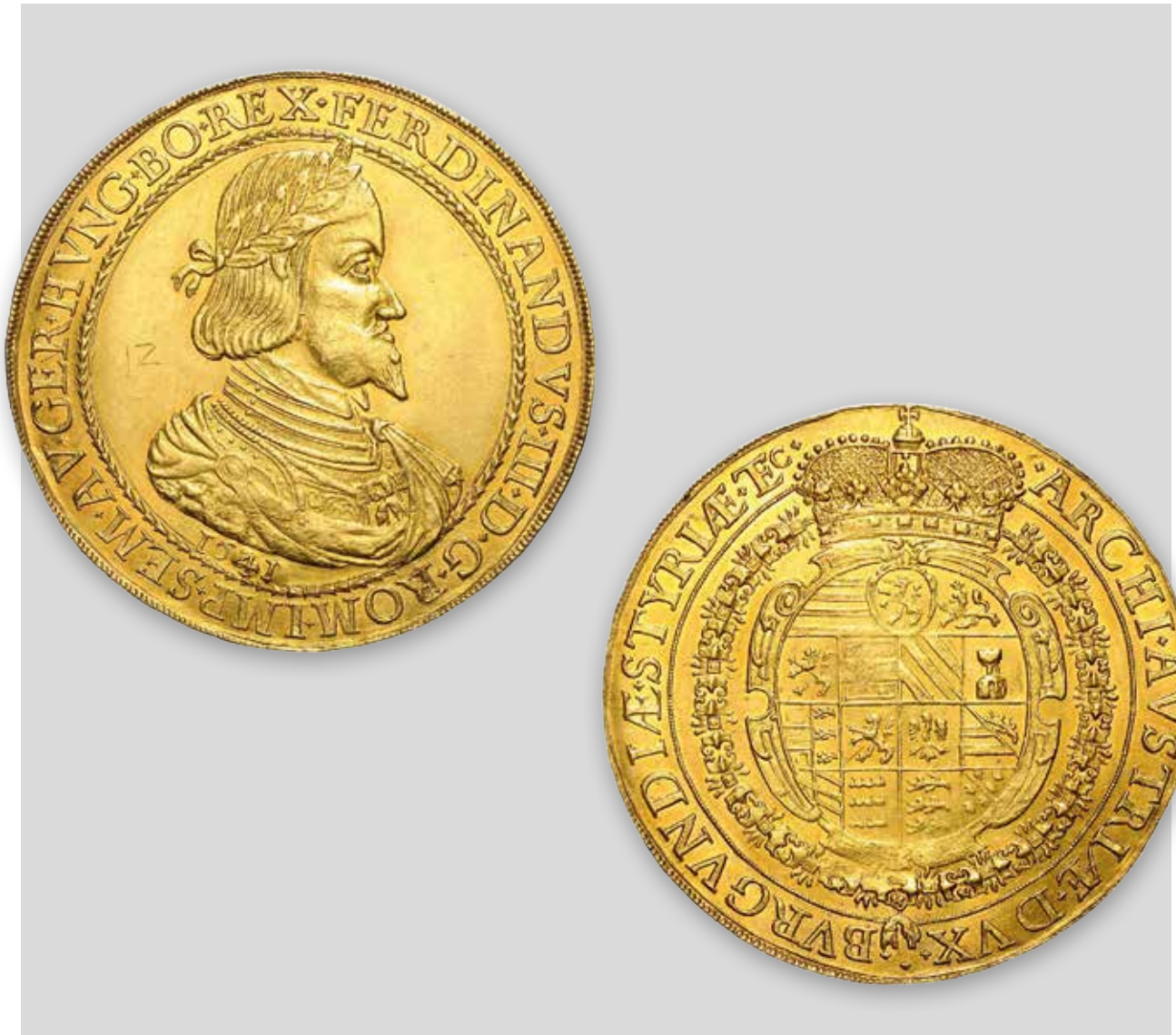
Ferdinand III. 12 Dukaten 1641 Graz, erzielter Preis € 240.000