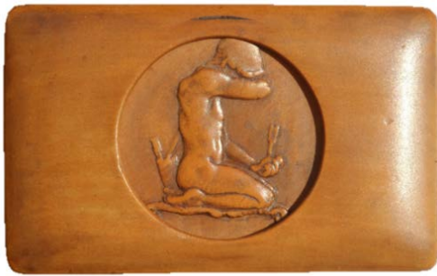
„Reue“1914 Zinkalausführung 120 mm Medaille der Ostmark Nr. 02 Holzmotiv 43 mm Abb. 1