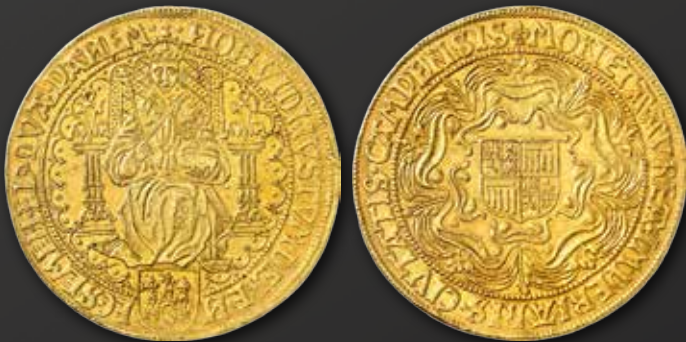
Künker-Auktion 362 Niederlande. Stadt Campen. Achtfacher Rosenoble o. J. (1600). Geprägt nach dem Vorbild des vierfachen Sovereign der englischen Königin Elisabeth. Schätzung: 250.000 Euro, Zuschlag: 700.000 Euro