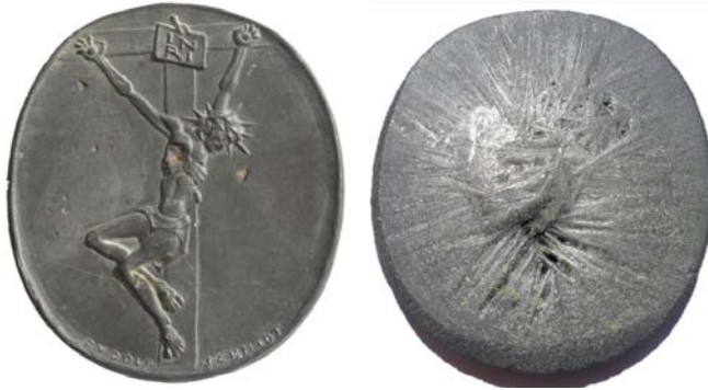
„Der Gekreuzigte“ 2, vor 1954 Guss 112 x 126 mm In Schwefelpaste Abb. 5 und 6

Verschiedene Arbeiten hat Rudolf Schmidt mittels Schwefelpaste hergestellt. Diese Paste konnte man in Dosen oder Tuben erwerben. Angewandt wie Gips, konnte ein Negativ mit der Masse befüllt und ein Positiv erzeugt werden. An der Luft härtete das Material aus. Die Motivseite wurde präzise und schön, auf der Rückseite bildete sich das Material interessant aus. Berührt man diese Medaillen auch nur kurz, hinterlässt es an den Händen den mutmasslichen Geruch der Hölle.