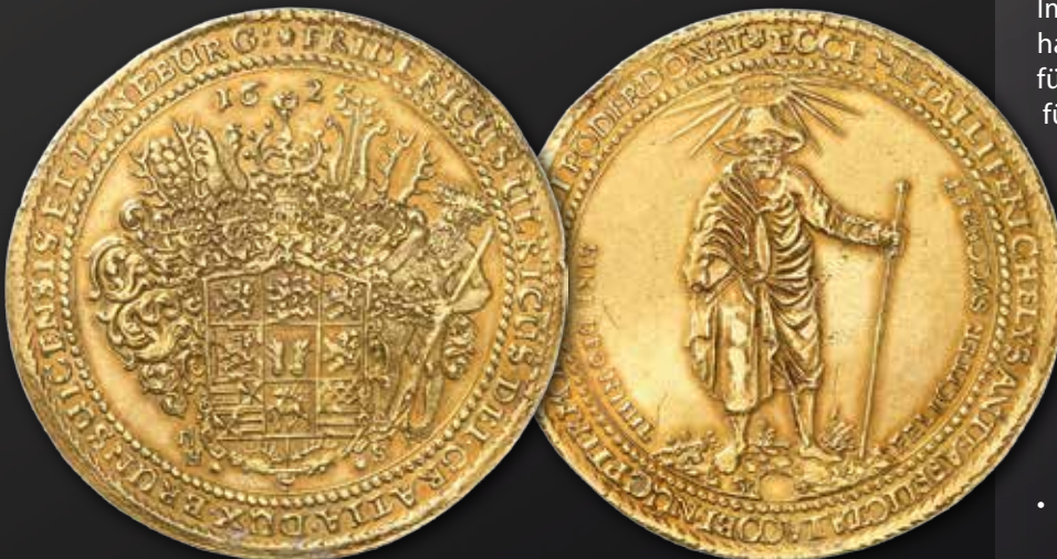
Die Preussag-Sammlung, Teil 1 Fürstentum Braunschweig-Wolfenbüttel. Friedrich Ulrich, 1613 - 1634. Löser zu 20 Goldgulden 1625, Goslar oder Zellerfeld. Schätzung: 210.000 Euro, Zuschlag: 910.000 Euro