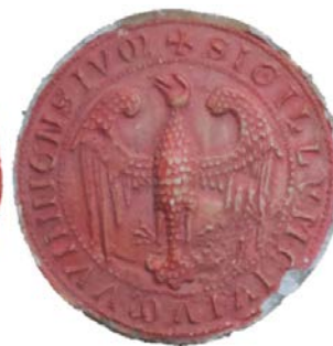
„Ältestes Stadtsiegel der Stadt Wien“ Komplettes Produkt Abb. 10 Wachseinlage Abb. 11 Gipsguss Abb. 12