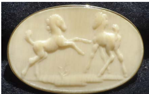
„Fohlen“ Nr. 34, 1928 Guss, oval, einseitig, 180 x 120 mm Brosche aus Elfenbein 40 x 25 mm Medaille der Ostmark Nr. 34, Tafel 63 Brosche aus Elfenbein 40 x 25 mm Abb. 2

Verschiedene Arbeiten aus Elfenbein sind in der Familie als Broschen erhalten geblieben: eine im Material Zinkal weit verbreitete Medaille „Fohlen“ und „Hella“, meine im Alter von 2 Jahren dargestellte Tante. Auch hier kam die Reduziermaschine zum Einsatz.