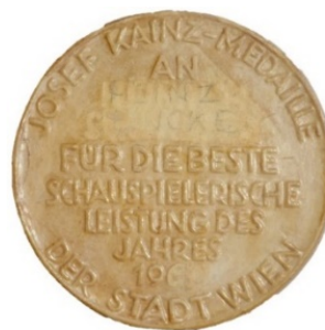
„Josef Kainz“, 1957 Bronze 85 mm Avers in Bronze Abb. 7 Revers in Bronze Abb. 8 Gips in Bearbeitung Abb. 9

Einen weiteren Auftrag erhielt Schmidt ab 1961 für mehrere Jahre von der Magistratsabteilung 7 der Stadt Wien, um Wachsabgüsse des „Ältesten Stadtsiegels der Stadt Wien herzustellen.